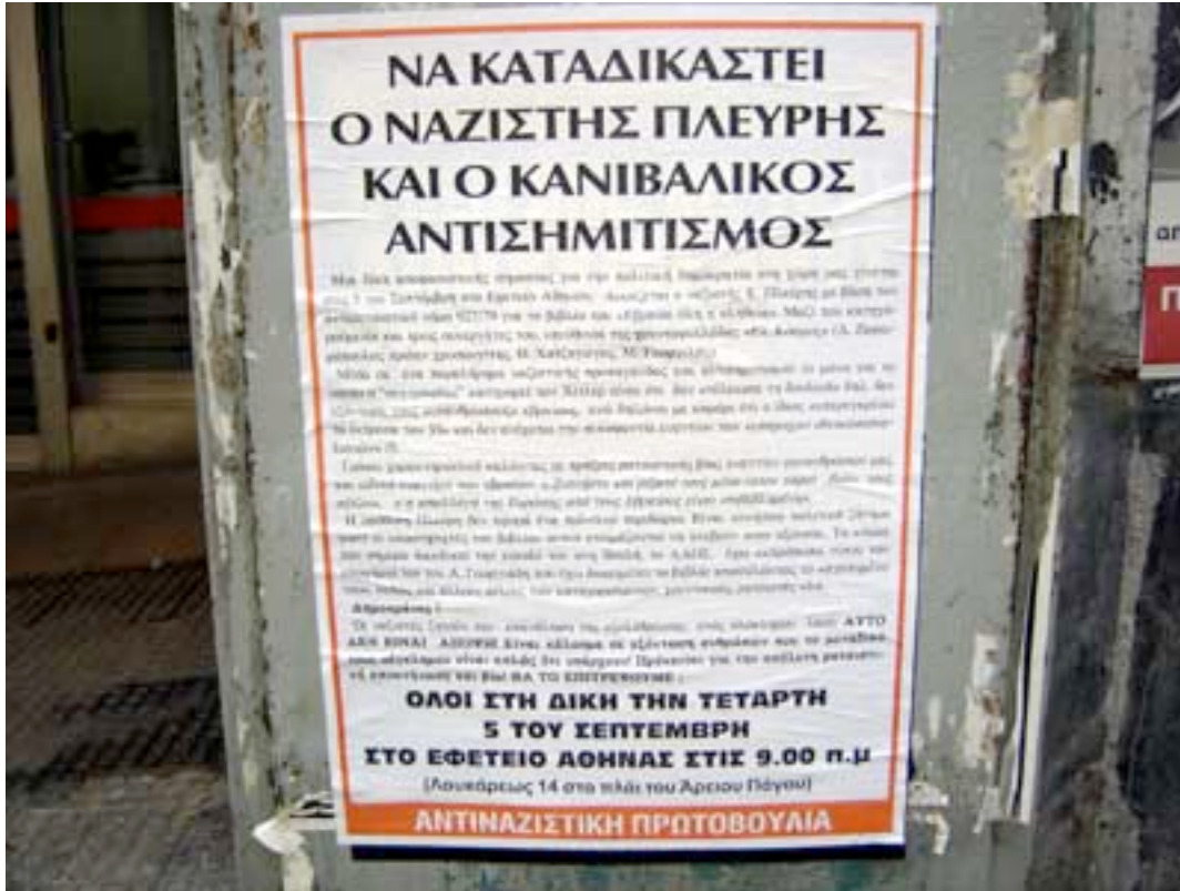
Affiche contre "le nazi Plevris" et "l'antisémitisme cannibale"